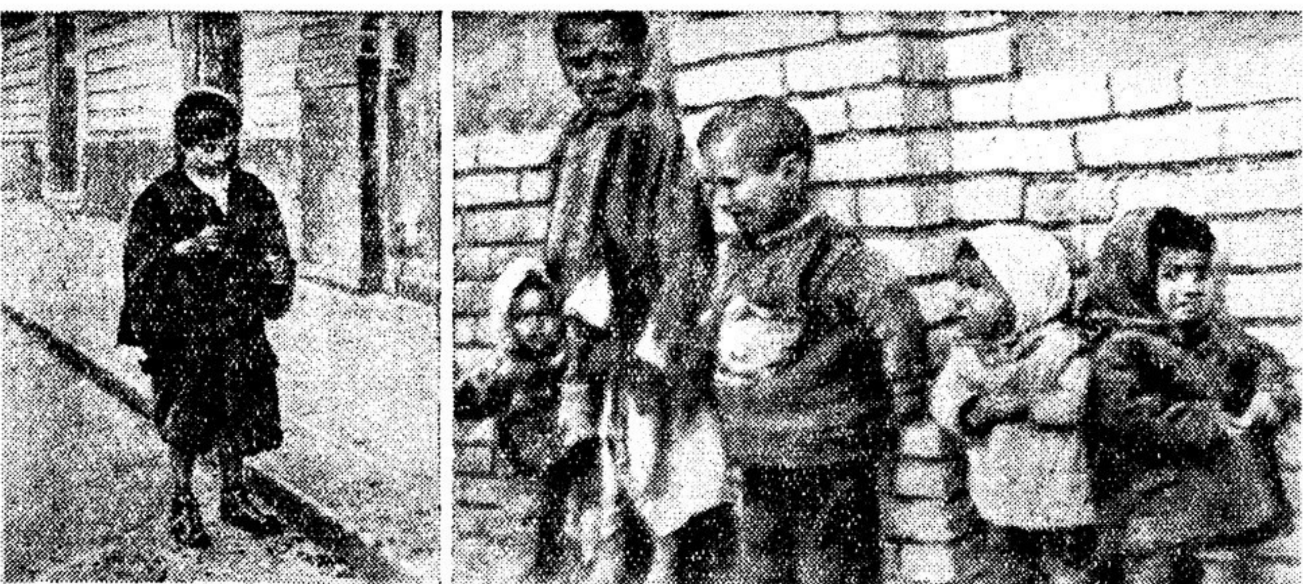
ДЕТИ УЛИЦЫ: слева — в Италии де Гаспери многие дети, как этот мальчик из города Катания (остров Сицилия), вынуждены добывать себе кусок хлеба, собирая падающие орехи и продавая оставшиеся в них табак; справа — обычная картина на улицах городов Ирака — голодные оставшиеся в них табак; справа — обычная картина на улицах городов Ирака — голодные оставшиеся в них табак.

На лондонской автобусной стоянке Стояла как-то два солдата-янки. Большая очередь автобуса ждала. Машина подошла. Все пассажиры сели. Лишь два американца не успели — Кондукторша выпустить их просто не смогла. И дверь у них закрылась перед носом. И вот, пока еще не двинулись колеса. Сквозь зубы процедил солдат чужой земли: «Я вижу в первый раз, чтоб дверь закрывалась перед нами». Перед лицом солдат, что словно воевали И, выиграв войну, Британию спасли! Кондукторша не растерялась: «Вы разве русские? Как я не догадалась!» В Москву из Лондона был эту привезли