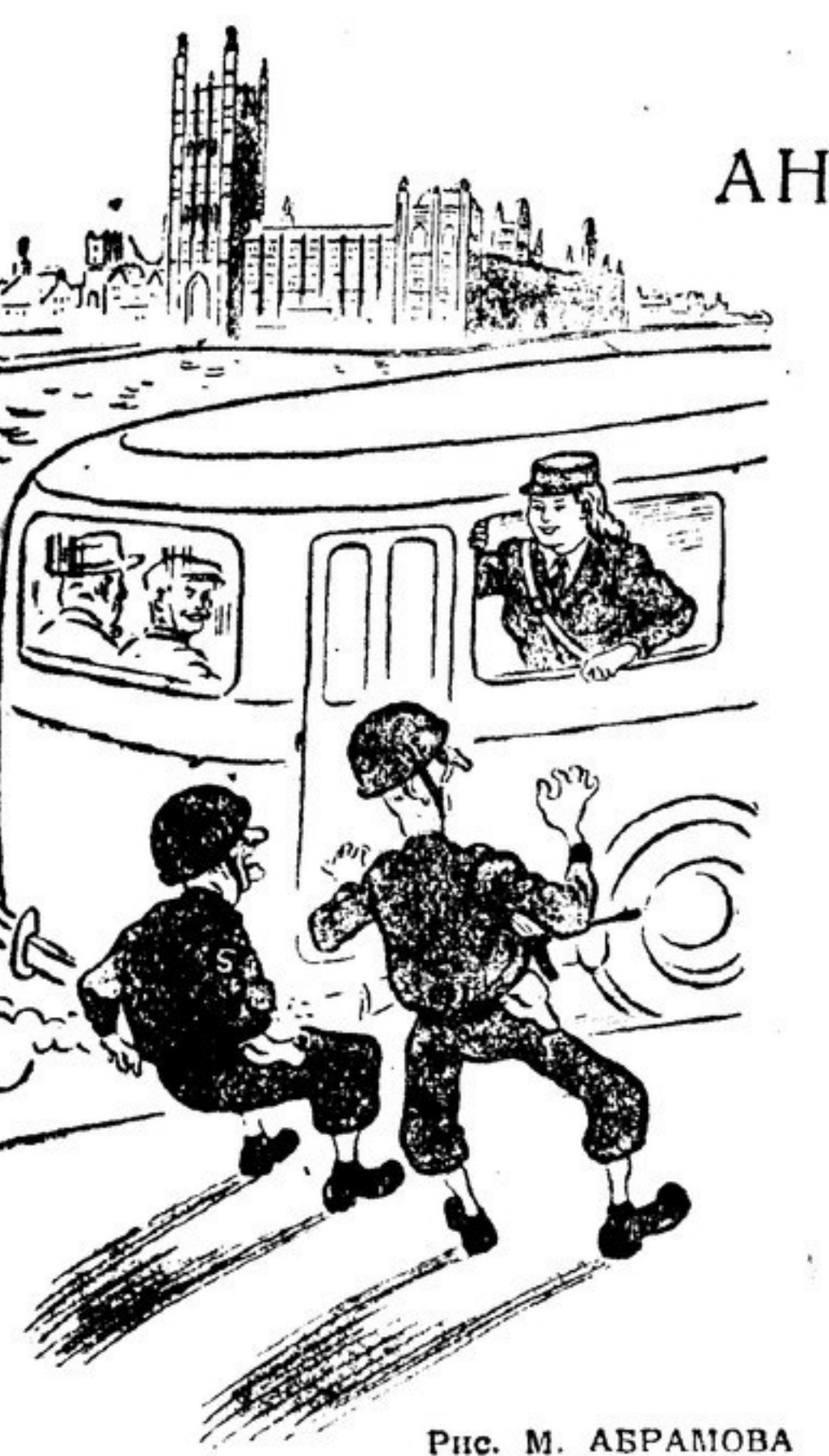
Рис. М. АБРАМОВА

Детская смертность в Иране огромна: по официальным данным, 85 процентов детей умирают, не дожив до 15-летнего возраста.